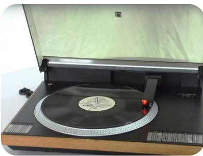
უმალლესი კლასის სტერეოსისტემა „Б1-04“.

ელექტრონიკა, მეცნიერების, ტექნიკისა და მრეწველობის დარგი, რომელიც სწავლობს ვაკუუმში, აირებში, სითხეებში, მყარ სხეულებსა და პლაზმაში (აგრეთვე მათ საზღვრებზე) ელექტრონების ურთიერთქმედებას ელექტრომაგნიტურ ველებთან, მათში მიმდინარე პროცესებს და იყენებს მათ ელექტრონული ენერგიის გარდასაქმნელად, ინფორმაციის მიღების, გარდაქმნის, შენახვისა და გადაცემისათვის. ე-ის ამოცანაა სხვადასხვა სფეროში ელექტრონული ხელსაწყოების, აპარატურის და დანადგარების შემუშავება, წარმოება და გამოყენება.