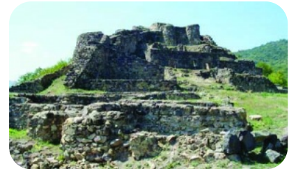
დმანისის ნაქალაქარი (შიდა ციხე).

ბუნება მუნიციპალიტეტის დას. ნაწილი მოიცავს ჯავახეთის მერიდიანულ ქედს, რ-იც აგებულია ახალგაზრდა ეფუზიური ქანებით (ბაზალტური, ანდეზიტ-ბაზალტური, ლიპარიტ-დაციტური ლავები). ქედის მოვაკებულ თხემზე აღმართულია მწვერვალები: დავაკრანი, შამბიანი, აღრიქარი და ემლიქლი. აღმ. დამრეცი კალთა დასერილია კანიონისებრი ხეობებით. მუნიციპალიტეტის შუა ნაწილი