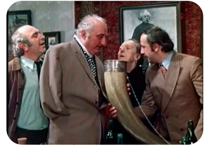
ი. კ ვ ი რ ი კ ა ძ ე კადრი ფილმიდან "ქალა- ქიანარა" 1976

კ-ის სცენარებით გადაღებულია ანიმაციური ფილმები: „ტალანტი“ (რეჟ. ბ. შოშიტაიშვილი, 1981), „ახლა გამოფრინდება ჩიტი“ (რეჟ. ი. სამსონაძე, 1983), „ჟანგიანი რაინდი“ (1984), „ბო-ბო“, (1985); ორივეს რეჟ. ლ. ჭყონია, „ლოკოკინა“ (რეჟ. ვ. ბახტაძე, 1986); მხატვრული ფილმები: „რობინზონი და, ანუ ჩემი ინგლისელი პაპა“ (რეჟ. ნ. ჯორჯაძე, 1986), „ურჩხული, ანუ ვიღაც სხვა“ (რეჟ. ა. ფატხულინი, 1988, „უბბეკფილმი“), „ლიმიტა“ (რეჟ. დ. ევსტიგნევი, 1994, „სტუდია 29“; რუსეთის კინოაკადემიის პრემია „ნიკა“, 1995), „შეყვარებული კულინარის 1001 რეცეპტი“ (რეჟ. ნ. ჯორჯაძე, 1996), „„ზაფხული, ანუ 27 დაკარგული კოცნა“ (2000), „ფოსტალიონი“ (2003), „მეტეოდიოტი“ (2008; სამივეს რეჟ. ნ. ჯორჯაძე); სატელევიზიო სერიალი „პეჩორინი. ჩვენი დროის გმირი“ (მ. ლერმონტოვის მიხედვით, რეჟ. ა. კოტი, 2006, რფ), „ანდერსენი. ცხოვრება უსიყვარულოდ“ (რეჟ. ე. რიაზანოვი, 2006, „მოსფილმი“), „მამა“ (რეჟ. ი. სოლოვიოვი, 2007, რფ) და სხვ.