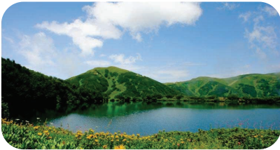
კინტრიშის დაცული ტერიტორიები

კინტრიშის დაცული ტერიტორიები, მდებარეობს ქობულეთის მუნიციპალიტეტში, შავ ზღვასა და აჭარა-იმერეთის მთათა სისტემას შორის, მდ. კინტრიშის ხეობაში, სოფ. ცხემვანსა და ხინოს მთას შორის, ზ. დ. 300-2500 მ-ზე. მთები ზღვის ტენიან ჰაერს აკავებს და კინტრიშის ტერიტორიაზე ჭარბტენიან ჰავას წარმოქმნის, რაც აქ უნიკალური ფლორის არსებობის განმსაზღვრელი ფაქტორია. დაცულ ტერიტორიებს ჩრდ-ით