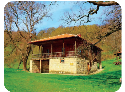
დ. კლდიაშვილის სახლ-მუზეუმი. სოფელი ბედა სიმონეთი. XIX ს. II ნახ.

კ-ის შემოქმედების მთავარი თემა – იმერეთის გაღარიბებული, ე. წ. „შემოდგომის აზნაურების“ ცხოვრების მწუხრის ასახვა – პირველად გამოჩნდა მოთხრობა „სოლომან მორბელაძეში“ (1894). ახ. საზ. ურთიერთობათა დამკვიდრებამ ეკონ. ნიადაგი გამოაცალა თავად-აზნაურთა წოდებრივ პრივილეგიებს. გაღარიბებული აზნაურების თავმომწონეობა სრულიად არ შეესაბამებოდა რეალურ ვითარებას. სწორედ აქ დაინახა კ-მა თავისი „ცრემლნარევი სიცილის“ სათავე; განწირული აზნაურების შინაგანი ტრაგიკული ბუნება მან გარეგნულად კომიკური ფორმით გამოხატა, რამაც მის სამწერლო სტილს განუმეორებელი, მხოლოდ კ-თვის დამახასიათებელი ინდივიდუალობა მიანიჭა. ამ მხრივ აღსანიშნავია მისი მოთხრობები: „სამანიშვილის დედინაცვალი“ (1897), „ქამუშაძის გაჭირვება“ (1900), „როსტომ მანველიძე“ (1910).