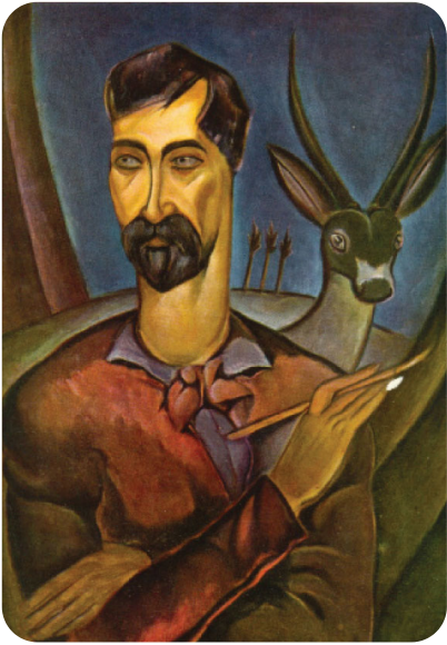
ლ. გუდიაშვილი. "ნიკო ფიროსმანაშვილი". 1928.

გ. მკაფიოდ გამოსახული ინდივიდუალობის მქონე შემოქმედია, რ-მაც მხატვრულ სახეთა საკუთარი მდიდარი სამყარო შექმნა. შინაარსის შესაბამისად, გ. თავის სურათებსა და ნახატებში ხან სადღესასწაულო, ამაღლებულ, „ზღაპრულ“ განწყობილებას ქმნის, ხან ფსიქოლოგიურად ღრმასა და დრამატულს, ხან თეატრ. სანახაობას, ხანაც გროტესკისას. მისი ნამუშევრები გამოირჩევა დახვეწილი და დასრულებული კომპოზიციით, დეკორაციულობითა და, ზოგჯერ, ორნამენტულობითაც. გ-ის შემოქმედებამ საერთაშ. აღიარება მოიპოვა. მისი ნამუშევრები დაცულია საქართვ. ეროვნ. მუზეუმში, მის ოჯახში, საქართვ. და უცხოეთის კერძო კოლექციებში. გ-ის სახელი ეწოდა მცირე ცთომილს (იხ. სტ. გუდიაშვილი). საქართველოში და უცხოეთის სხვადასხვა ქვეყნებში გამოცემულია მხატვრისადმი მიძღვნილი მრავალი ალბომი და წიგნი. დაკრძალულია მთაწმინდის პანთეონში. საფლავზე დგას გ-ის ძეგლი (მოქანდაკე ე. ამაშუკელი,