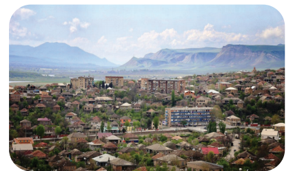
კასპი. საერთო ხედი.

ბუნება. კ. მ-ის მთავარი ოროგრაფიული ერთეულია თრიალეთის ქედი (მთა ობოლი კლდე, 2022 მ). მუნიციპალიტეტის ფარგლებში შედის ქედის ჩრდ. კალთა. იგი აგებულია ინტენსიურად დანაოჭებული ზედაცარცული (შუა კალთებზე – კარბონატული) და მესამეული ასაკის ქანებით (თიხა, ქვიშაქვა, მერგელი, ალაგ-ალაგ – ვულკანოგენური წყება). კალთაზე კარგად არის გამოხატული საშ. სიმაღლის მთა-ხეობათა რელიეფი და საფეხურებრივად განლაგებული მოვაკებული ზედაპირები, ხოლო დაბლა სერებიან-ბორცვიანი მთისწინეთია. მუნიციპალიტეტის შუა ნაწილი უჭირავს მეოთხეული ალუვიური ნალექებით აგებულ მტკვრისპირა ტერასულ ვაკეს.