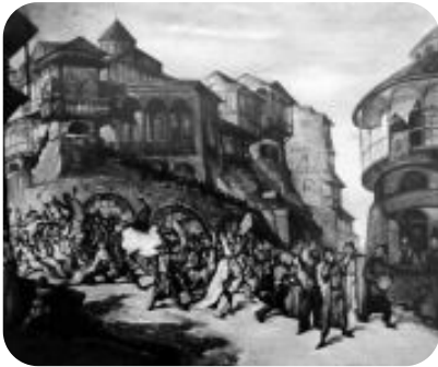
"ყვენობა". მხატვარი ლ. გუდიაშვილი 1937

თბილ. (1756) და თელავის (1780) სემინარიების გახსნის შემდეგ აღორძინდა სასკოლო თეატრი, რ-ის ერთ-ერთი გამოჩენილი მოღვაწე იყო თელავის სემინარიის ხელმძღვანელი დავით რექტორი.