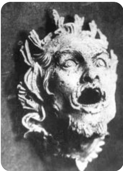
თეატრის ანტიკური ნიღაბი

შემდგომი პერიოდის მნიშვნელოვანი სპექტაკლებია: ნ. გოგოლის „რევიზორი“ (რეჟ. ა. თაყაი შვილი, 1951, მარჯანიშვილის სახ. თეატრი), ა. ოსტროვსკის „უდანაშაულო დამნაშავენი“ (რეჟ. ა. ვასაძე, 1959), „ზოგჯერ ბრძენიც შეცდება“ და გ. სუნდუკიანის „პეპო“ (ორივეს რეჟ. დ. ალექსიძე; 1944, 1951; სამივე დაიდგა რუსთაველის თეატრში).