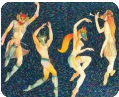
"ბერიკაობა". მრატვარი გ. დოლიძე. 1999.

ქრისტიანობის სახელმწ. რელიგიად გამოცხადების შემდეგ (IV ს. 30-40-იანი წლები) წარმართული პოეზია განადგურდა და შეიქმნა საეკლ. თეატრი და დრამა, პარალელურად ვითარდებოდა ხალხ. თეატრ. სანახაობები – ბერიკაობა და ყვენობა.