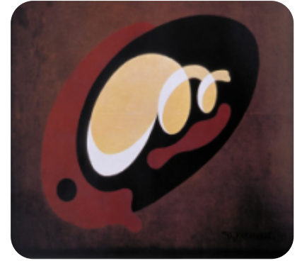
დ. კ ა კ ა ბ ა ძ ე. კომპოზიცია. 1923. კერძო საკუთრება.

კ. არის მოდერნიზმის ეპოქისა და ახ. ქართ. ხელოვნების ერთერთი გამოჩენილი წარმომადგენელი. მის მიერ შექმნილი სურათები დიდი კომპოზიციური ოსტატობით, ფერადოვანი დახვეწილობითა და სიფაქიზით არის შესრულებული. რაციონალურობასთან ერთად მის ნამუშევრებში მჟღავნდება განსაკუთრებული პოეტურობა. კ-მ პირველმა შექმნა ქართული ბუნების ამსახველი განმაზოგადებელი სურათი.