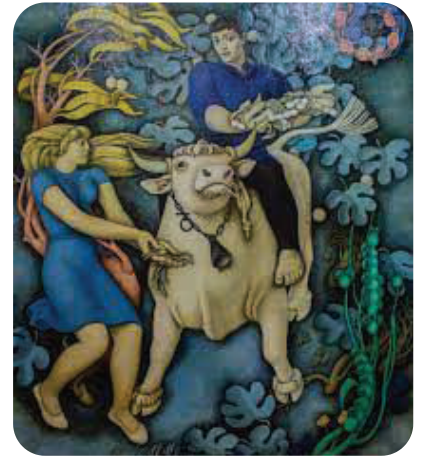
კ. მ. მ ა ხ ა რ ა ძ ე. "თეთრი ხარი".

შემოქმედებას ახასიათებს გამოსახულების მონუმენტალიზაციის ტენდენცია - იქნება ეს ისტ. წარსული თუ თანამედროვე რეალობა. რეალისტური ხელოვნების ტრადიციით შესრულებული მისი სადიპლომო ნამუშევარი იყო „სუვოროვი და ბაგრატიონი ალპებში“ (1952), რ-იც ისტ.-ბატალურ ჟანრს მიეკუთვნება. იმავე ჟანრს განეკუთვნება სურათი „ასპინძის ბრძოლა“ (1961, ორივე თბილ. სამხატვრო აკადემია). 1967 მხატვარმა შექმნა ალეგორიული ხასიათის დიდი ტილო - „მინა ქართული“, რ-იც წარმოადგენს ერთ-ერთ ყველაზე მასშტაბურ პანოს საქართველოში. ასევე ალეგორიულია სურათი „თეთრი ხარი“ (1969, ორივე შ. ამირანაშვილის სახ. ხელოვნების სახელმწ. მუზეუმი). მ-ის ძირითად ნამუშევართა შორის აღსანიშნავია სერია „იტალია“ (1976), „ბაკურიანი“ (1981), „გველის მომთვინიერებელი“