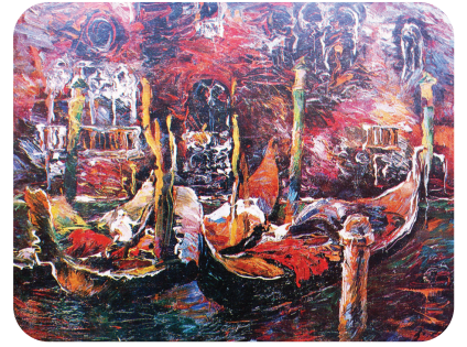
კ. მ. მ ა ხ ა რ ა ძ ე. "ვენეცია". სერიიდან "იტალია". 1976.

კაჯურახო“ (1983), „დიდგორი“ (1985), „ამაღლება“ (1987), „ცეცხლითა და მახვილით“ (1988), სერია „ძველი თბილისი“ (1989). მ. ნაყოფიერად მუშაობდა გრაფიკის, მ. შ. წიგნის გაფორმების დარგში. მისი გაფორმებულია ი. ჭავჭავაძის „მგზავრის წერილები“, ი. აბაშიძის „რას გადაურჩა თბილისი“ და სხვ. 1953-იდან მონაწილეობდა სხვადასხვა სამხატვრო, მ. შ. თბილ. ტრადიციულ საგაზაფხულო და საშემოდგომო გამოფენებში; მისი ნამუშევრები გამოიფინა მოსკოვში, მანჩუსის საგამოფენო დარბაზში (1980), დელიში, ინდოეთის საგარეო საქმეთა სამინისტროში (1983), სტოკჰოლმის მერიაში (საქართვე. კულტურის დღეები, შვედეთში, 1988), ნიუ-იორკში, ჰოვსტრას უნ-ტში. მ-ის ნამუშევრები დაცულია შ. ამირანაშვილის სახ. ხელოვნების სახელმწ. და კიევის ხელოვნების მუზეუმებში, დ. შევარდნაძის სახ. საქართვე. ეროვნ. და ტრეტიაკოვის სახელმწ. (მოსკოვი) გალერეებში, თბილ. სახელმწ. სამხატვრო აკადემიაში, კერძო კოლექციებში.