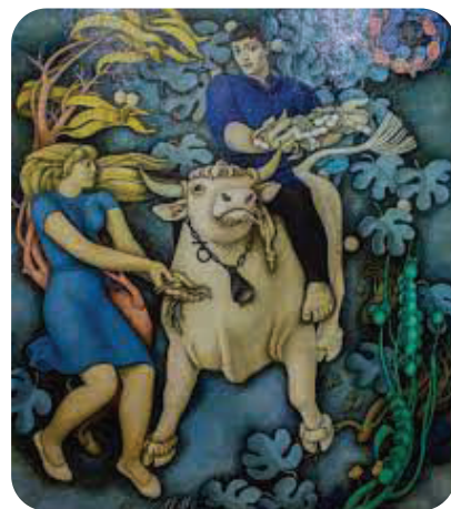
კ. მ. მ ა ხ ა რ ა ძ ე. "თეთრი ხარი". 1969. შ. ამირანაშვილის სახელობის ხელოვნების სახელმწიფო მუზეუმი. თბილისი.

შემოქმედებას ახასიათებს გამოსახულების მონუმენტალიზაციის ტენდენცია - იქნება ეს ისტ. წარსული თუ თანამედროვე რეალობა. რეალისტური ხელოვნების ტრადიციით შესრულებული მისი სადიპლომო ნამუშევარი იყო „სუვოროვი და ბაგრატიონი ალპებში“ (1952), რ-იც ისტ.-ბატალურ ჟანრს მიეკუთვნება. იმავე ჟანრს განეკუთვნება სურათი „ასპინძის ბრძოლა“ (1961, ორივე თბილ. სამხატვრო აკადემია). 1967 მხატვარმა შექმნა ალეგორიული ხასიათის დიდი ტილო - „მინა ქართული“, რ-იც წარმოადგენს ერთ-ერთ ყველაზე მასშტაბურ პანოს საქართველოში. ასევე ალეგორიულია სურათი „თეთრი ხარი“ (1969, ორივე შ. ამირანაშვილის სახ. ხელოვნების სახელმწ. მუზეუმი). მ-ის ძირითად ნამუშევართა შორის აღსანიშნავია სერია „იტალია“ (1976), „ბაკურიანი“ (1981), „გველის მომთვინიერებელი“